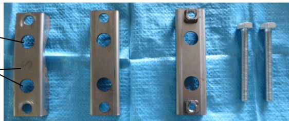
S(シングル)用上板 W用上板 下板(W.S共通) ボルト