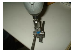
レンチで締めれば完成